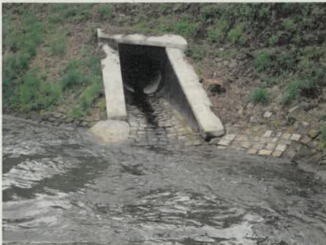
Fot. 3. Wylot W28

Handwritten signature and initials in blue ink.