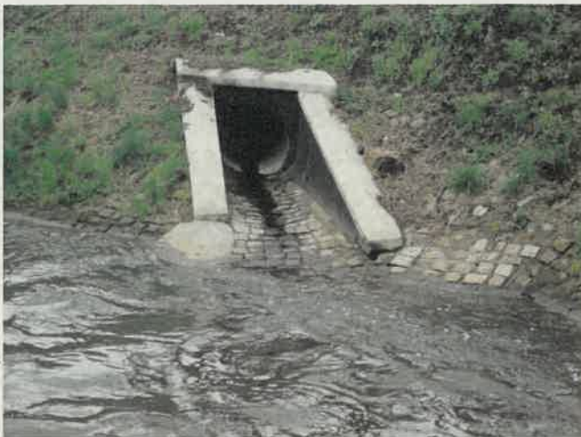
Fot. 1. Wylot W28

Dokumentacja fotograficzna z oględzin przeprowadzonych w dniu 14.04.2023 r. na wylocie W28 w Gliwicach zlokalizowany w km 49+057 rzeki Kłodnicy. Ustalono że Miasto Gliwice posiada pozwolenie wodnoprawne wydane przez Prezydenta Miasta Siemianowic Śląskich z dnia 30.05.2017 r. znak: RS.6341.8.2017 na odprowadzanie wód deszczowych ww. wylotem. Fotografie przedstawiają widok na wylot oraz teren wokół wylotu.