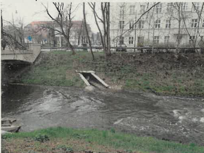
Fot. 2. Teren wokół wylotu W28